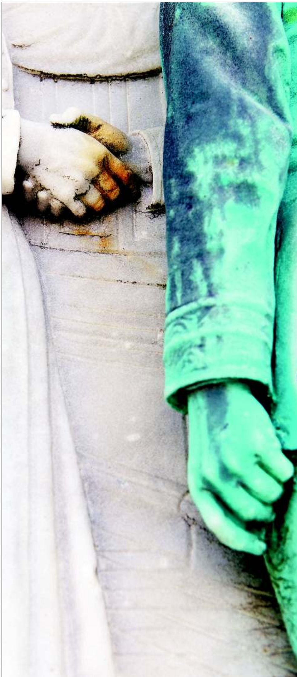
Ob zu Lebzeiten oder am Grab: Nach Ansicht von Jürgen Fliege ist es nie zu spät, einander die Hand zur Versöhnung zu reichen

Mein oberstes Anliegen ist, dass der Mensch glücklich wird, sein Herz weit macht und sagen kann: Ich habe ein erfülltes Leben gehabt, für das ich dankbar bin.