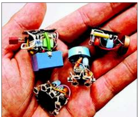
So sehen Schreibers kleine spielerische und experimentelle Arbeiten aus

Roboter. Dort unterrichtet er die Grundlagen: Wie man mit einem Lötkolben umgeht, wie man misst, ob der Strom auch korrekt fließt, was mit was verbunden sein muss, damit das Ganze am Ende lebt. Und vor allem vermittelt er Freude an diesen kleinen Objekten und ihrem Eigenleben.