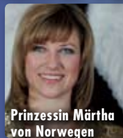
Prinzessin Märtha von Norwegen